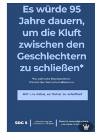
Blau und Hellbl... Deine Geschichte ...