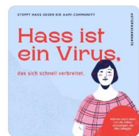
Blau Rot Fakete... Instagram-Beitrag ...