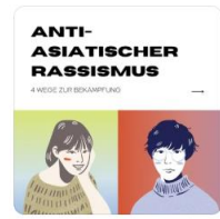
Weiß Spende/C... Instagram-Beitrag ...